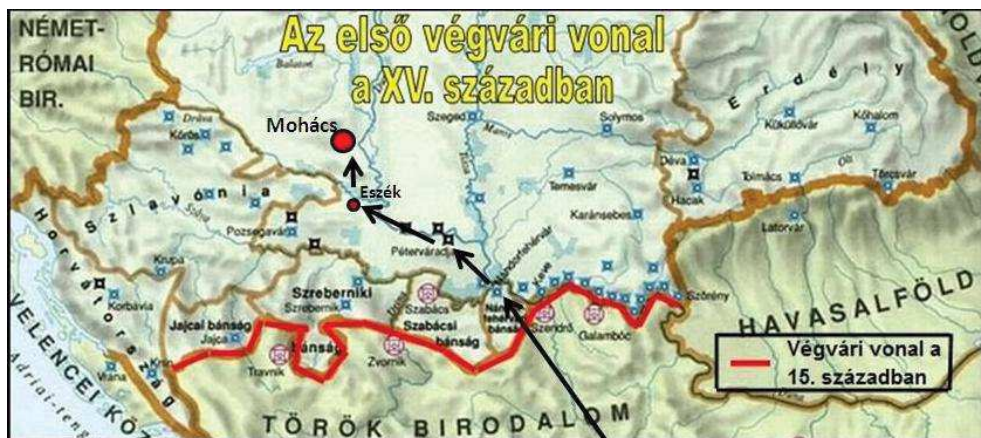
2. számú térkép