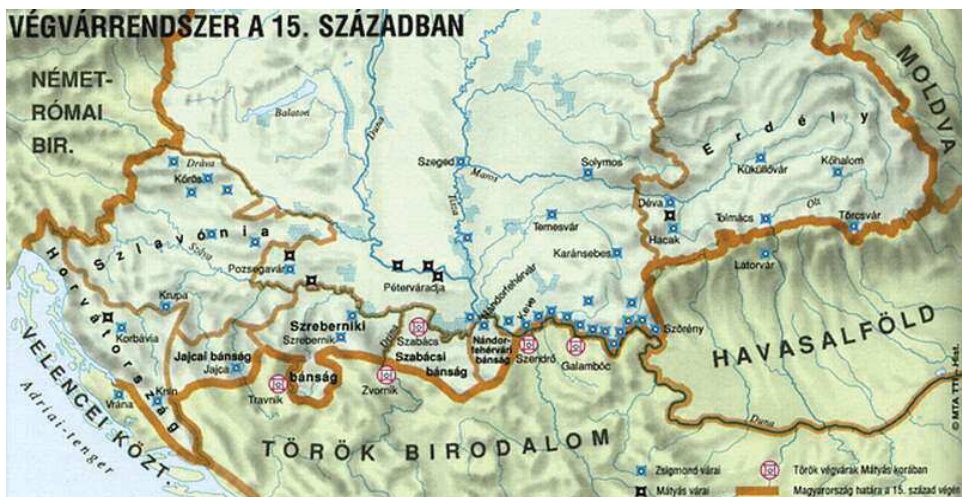
1. számú térkép Végvárrendszer a 15. században

arra gondolt, hogy a hadműveleteket az ország határain kívül tudja tartani. Boszniát, Szerbiát, Havasalföldet és Moldvát próbálta a Magyar Királysághoz kapcsolni. Az Oszmán támadás ekkor még az ország területi egységét nem bontotta meg, a végvárrendszer többek között pont ennek védelmét volt hivatott szolgálni. Ezek a fejedelemségek azonban csak addig ismerték el a magyar király főhatalmát, amíg a törökkel szemben számíthattak rá. Ha Magyarország meggyengült, az oszmánokkal próbáltak barátkozni”. 14 A végvárakat ekkor a Magyar Királyság déli határán építették ki, ahogy a két térkép 15 16 is látszik.