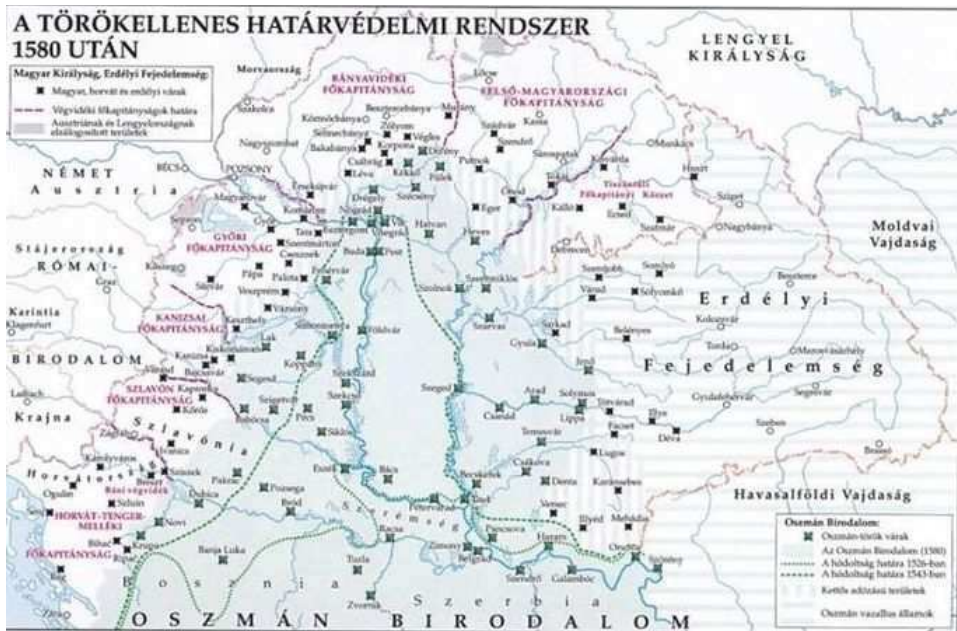
4. számú térkép A törökellenes határvédelmi rendszer 1580. után

Tóth Ádám Viktor – Polgár Miklós: A végvárrendszer, mint határvédelmi és határőrizeti intézmény kiépítésének alapjai és gazdasági bázisa a Magyar Királyságban