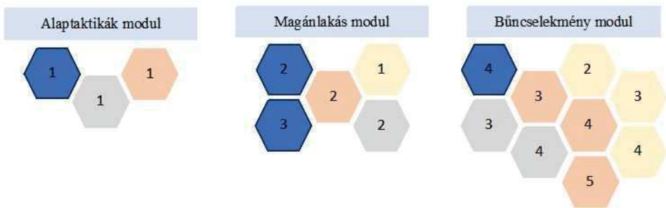
5. számú ábra

Az új oktatási modellben a tantárgyak ismereteinek oktatását szintén a négy tantárgyon keresztül az 5. számú ábra mutatja be.