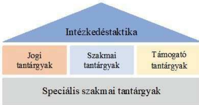
2. számú ábra

intézkedések gyakorlati végrehajtása során. Az Intézkedéstaktika oktatása során találkoznak először a tanulók a rendőri intézkedések valóságghú gyakorlati végrehajtásával, annak komplexitásával. Itt kaphatnak hiteles visszacsatolást a képességeikről, illetve az elsajátított kompetenciák – ismeretek, jártasságok, készségek – gyakorlati működtetéséről, az erősségeikről és a fejlesztendő területekről egyaránt, ezért ez meghatározó lehet az életükben, a pályafutásukban, karrierívükben. Ebből adódóan rendkívül körültekintően kell a foglalkozásokat megtartani. Különösen fontos a tanulók részére a pozitív visszacsatolás, a pozitív énkép erősítése és a pozitív élményekkel való gazdagodás. A tantárgyak háromszintű csoportosítását a 2. számú ábra tartalmazza.