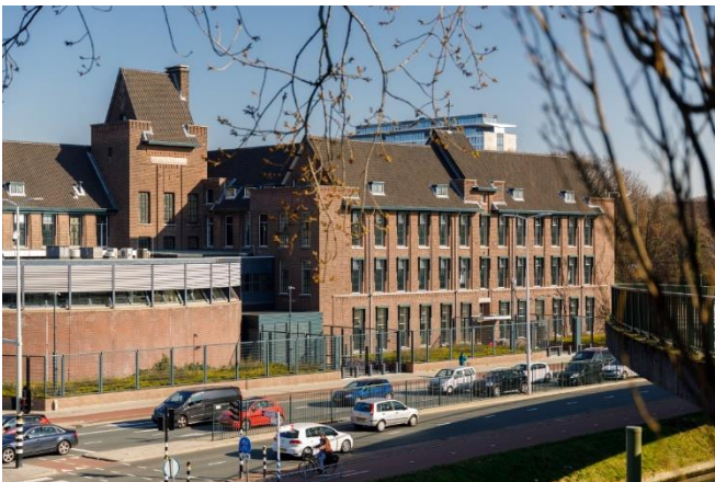
27. számú kép A Koszovói Különleges Törvényszéke épülete

Ami mindenképpen rendkívül pozitív, az az infrastruktúra fejlettsége. Országszerte „okos” megoldások vannak, nincs felesleges időtöltés a közlekedési lámpánál, az útburkolat kiváló minőségű országszerte. Mindenhova el lehet jutni kerékpárral, amelyet rendkívül sokan használnak, kerékpár mélygarázsok vannak a nagyobb városok központjaiban. Továbbá az online ügyintézés, adminisztráció is meglehetősen jól szervezett.