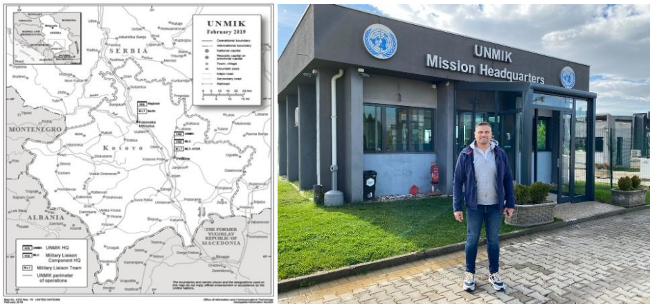
4-5. számú kép

Az alig több mint két megyényi területen megfigyelhető tendencia a fővárosba áramlás. 2011 és 2023 között Pristina lakosainak száma több mint a duplájára nőtt, mára megközelíti a félmilliót. 5 Az ország valamivel kevesebb, mint kétmillió fős összlétszámához viszonyítva, ez a lakosság több mint egynegyede. Ez a számadat vélhetően csökkenni fog a 2024. január 1. óta Koszovóra kiterjesztett vízumliberalizáció miatt. 6