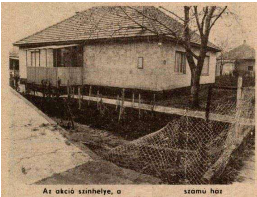
A terrorelhárítók által megostromlott ház. 66