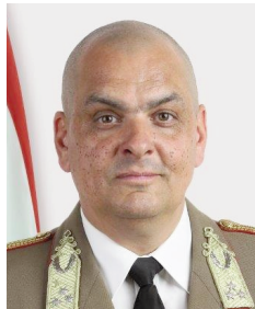
Korom Ferenc altábornagy Magyar Honvédség parancsnoka