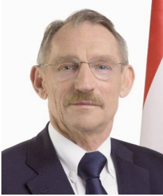
Dr. Pintér Sándor Magyarország belügyminisztere