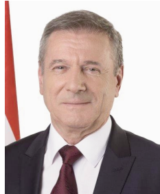
Dr. Benkő Tibor Magyarország honvédelmi minisztere