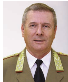
Dr. Benkő Tibor vezérezredes Honvéd Vezérkar főnök