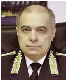
Papp Károly rendőr altábornagy országos rendőrfőkapitány