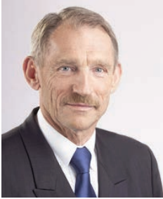
Dr. Pintér Sándor Magyarország belügyminisztere