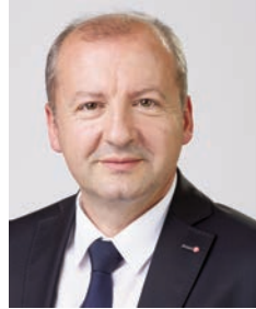
Dr. Simicskó István Magyarország honvédelmi minisztere